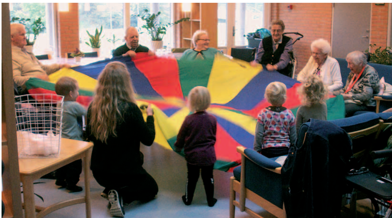
Samarbejde mellem to generationer. Bolden skal holdes i gang.

- Der er også en naturoplevelse i det. I dag har det blæst på vejen herhen, og det har været koldt. Vi har set en blå bus, høje huse og hørt fuglene synge oppe i træerne.