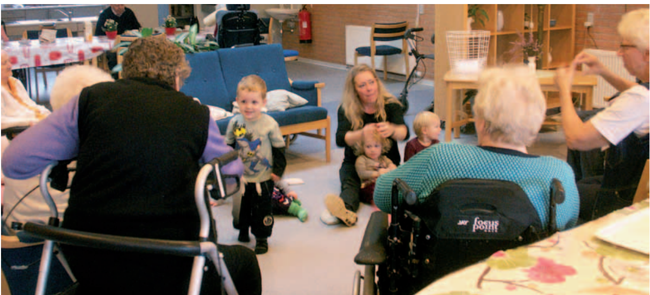
Der er kontakt. Børnene er nysgerrige men også trygge ved samværet med de ældre

- Jeg synes, det er godt, vi på den måde får børn ind på Kærdalen, for det skaber glæde. Det kan alle jo se.