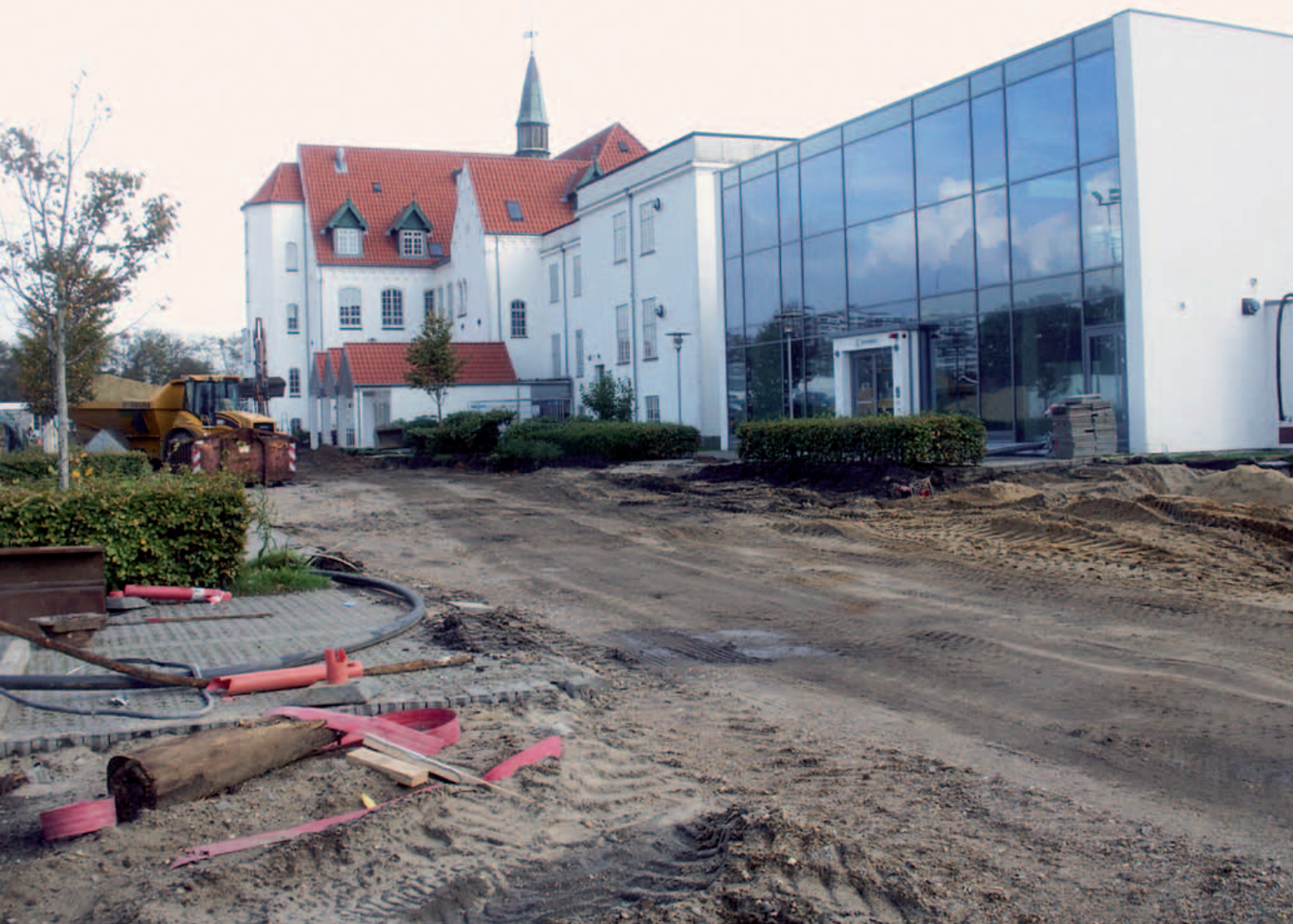
Der er netop taget nye lokaler i brug på Spangsbjerg, der danner rammen om psykiatrien i Esbjerg

sundhedspersonalet altid med. Her får vi lidt at vide om præparaters virkning og bivirkning samt dosis.