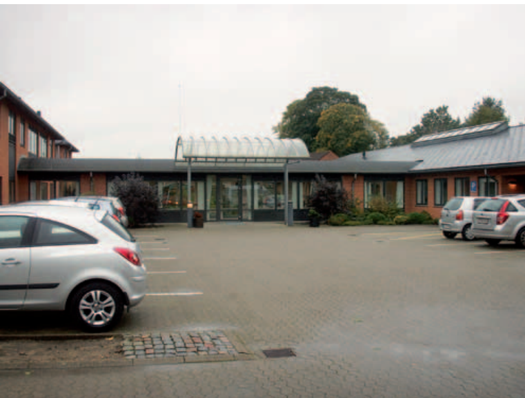
Nørregadehus er centralt beliggende i centrum af Vejen